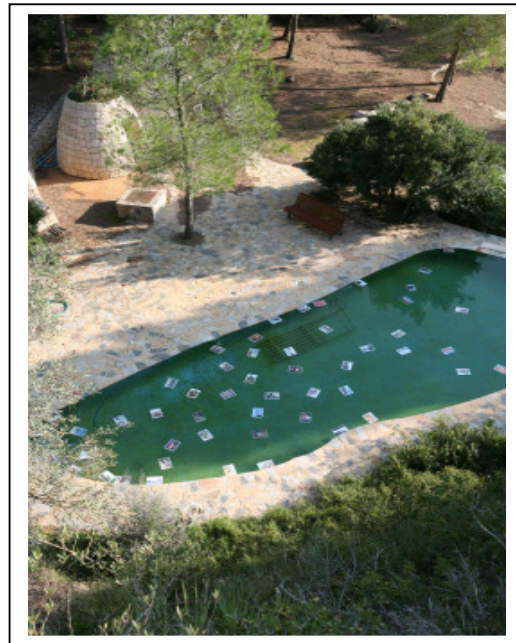
Resultado ya más regular