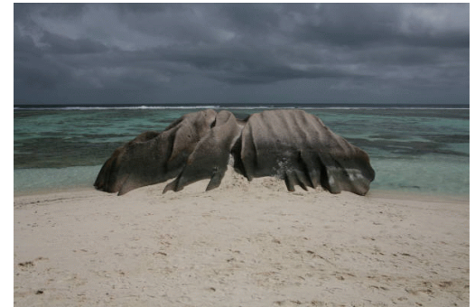
La roca probabemetete mas retratada en Seychelles