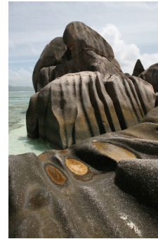
Que puede faltar mas