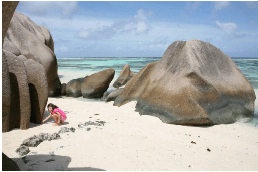
Niña jugando en playa