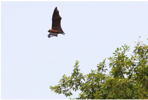
Murcielago gigante, come frutas