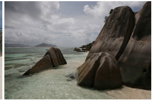
Seychelles.. que pasada