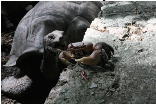
¿Se lo comerá?