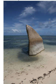
Mi roca favorita en Praslin