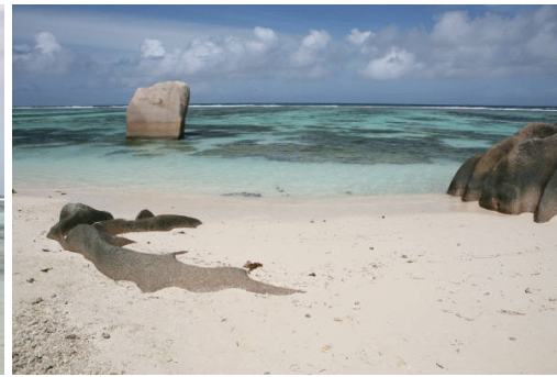
Playa con firma