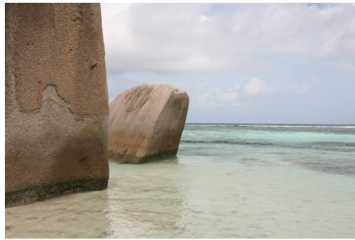
El granito siempre presente en la playas